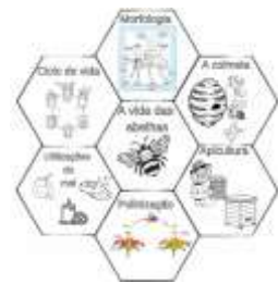
Imagem com o esquema